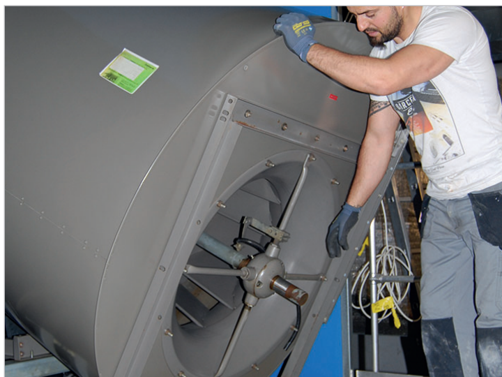
La vecchia ventola viene rimossa e...